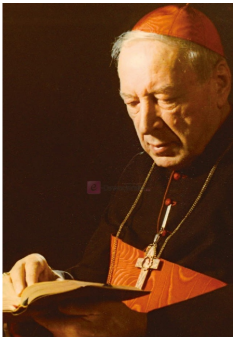
kard. Stefan Wyszyński